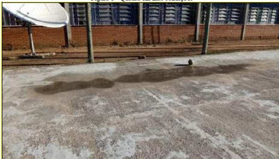
Figura 1 - Quadra em más condições

Abaixo, registro fotográfico da atual situação da quadra.